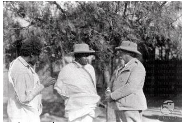
ሓበኛ 6 ወሉዳት ከም ዚነበርዎ ተሓቢረ ኣለኩ ኢዩ።

ብተወሳኺ'ውን፡ ኣብ'ቲ ምስ ሲሞኔታ ፖለራ ኣብ ዚገበርናዮ ሓጺር ወግዲ፡ ብዛዕባ ደቁ ኣድሂቡ ኣብ ዚዝረብ ይኹን ዚጸሓፍ ነገራት፡ ክእረም ዘለዎ ነጥቢ ኣውሲኣትላይ ኢዩ።ንሱ ከኣ፡ኣብዝሓ ጸሓፍቲ ወይ ኣብ ታሪኽ ዝግደሱ ወኸፋት፡አልቤርቶ ፖለራ፡ነቲ ዝሞተ ወዱ ጥራይ ስለ ዝፈልጡ ወይ ድማ ብዛዕባኡን ብዛዕባ ሞቱን ሓበሬታ ስለ ዝረከቡ፡ናቱ ክጸሓፍ ወይ ክዝረብ ምስማዕ ልሙድ ኮይኑ ምህላወ ኢዩ።እቲ ጆርጅ ዝበሃል ወዱ፡ንዓይ ኣብ ምጽሓፍ ብዘጋጠመኒ ጌጋ፡ 'ጂርጅ' ተባህሉ ሰፊሩ ከም ዘሎ፡እቲ ጽሑፍ ብዚተለጠፈ ኣስተውዒለ ኢዩ።ብዝኮነ ተኣሪሙ ክንቡብ ብኸብሪ ይዕድም ኣለኩ።