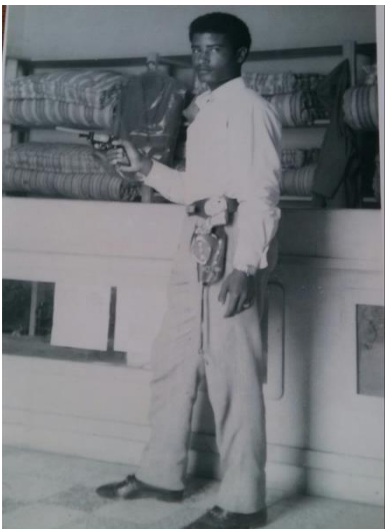
ሓድጉ ኣርኢያ ኣብቲ ለይቲ-ለይቲ ዚግልገለሉ ዚነበረ እንጻ ፍርናሽ

ሕምብርቲ ክበጽሑ ሰራዊት ኢትዮጵያ ስለ ዚተኸተሎም፤ ሓድጉ ንብጾቱን መራሕቱን ዚነበሩ ምስቲ ዚነበሮም ዋሕዲ ብኢድ ከይትሓዝዎ መታን ንሳቶም ከዝልቁ ንበይኑ ኣብ ምትጃስ ኣተወ፤ ኣድሒንዎም ከእ። ሰራዊት ኢትዮጵያ ንመጻናንዕን መምለስ እግርን ነታ መርሰደስ ወሲዶም ተመልሱ፤ ካብ መራሕ መኪና ጀሚርካ ኩላቶም ተጋደልቲ ግና ድሓኩ። ጅግና ሓድጉ ኣርኢያ ግና ብ23 ጥሪ 1975 ኣብ ንል-ሕምብርቲ ዚተባህለት ቦታ ተሰዊኡ ተሪፉ። ይኹን እምበር ጸላኢ ሬሳ ሓድጉ ከይረኸቦ ተመሊሱ፤ ስለዚ ከኣ ንሬሳኡ ብጾቱ ተመሊሶም ኣልዓልዎን ኣብቲ ቦታ መስዋእቱ ተቐብረን።